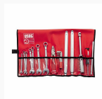
630 BN - Roll-up bag for motorcycle maintenance (20 pcs.)