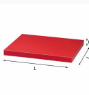
5002 Z1 - Distanziale