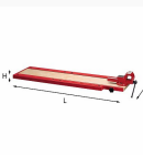
5002 ZM2 - Pianale con morsa