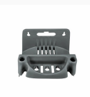
5002 S2 - Matrix - Supporto