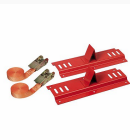
5002 S1 - Matrix - Supporto