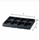
5003/8H - Sottovuoto