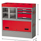
5006 EF6 - Assortimento lato sinistro