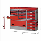
5006 E5 - Assortimento lato sinistro