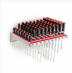
324 RP4 - Ripiano giraviti (100 pz)