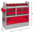
5006 EF2 - Assortimento lato sinistro