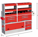
5006 C4 - Assortimento lato sinistro