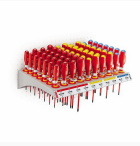
091 RP4 - Ripiano giraviti 1000 V (100 pz)