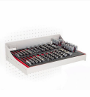
235 RP6 - Ripiano bussole con profilo speciale (122pz)