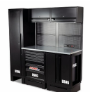
516 SA/CA - Arredamento per officina postazione base - pianale in acciaio