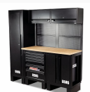
516 SA/CLP - Arredamento per officina postazione base - pianale in legno