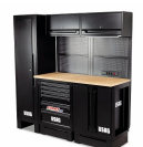
516 SA/CL - Arredamento per officina postazione base - pianale in legno